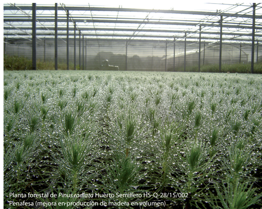
Planta forestal de Pinus radiata Huerto Semillero HS-Q-28/15/002 Penafesa (mejora en producción de madera en volumen)