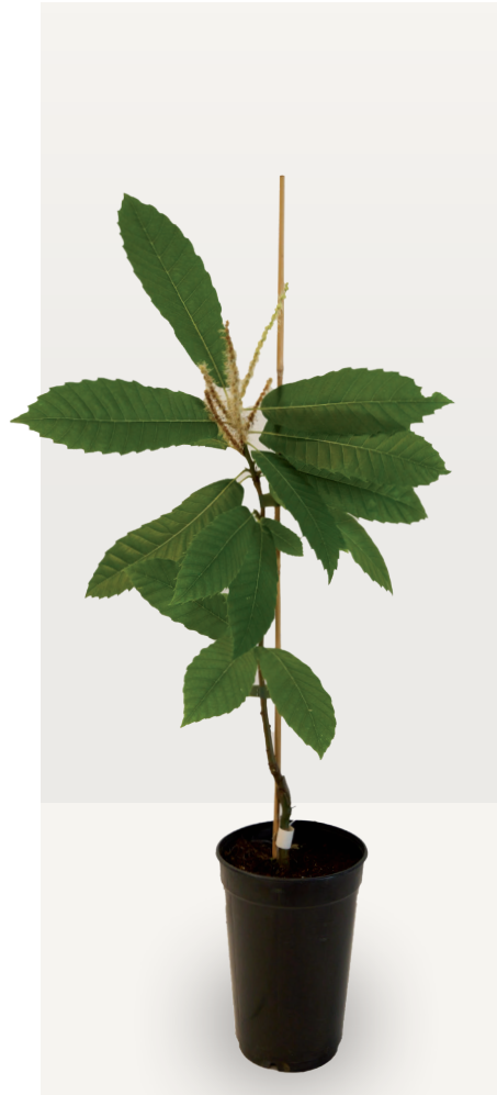
Injertos de 1 savia Envase de 1,5 L Grafted plants of 1 year 1,5 L container

Producción regular de castaño injertado en verde de variedades locales sobre portainjerto Maceda-P011 micropropagado. Otras variedades o grandes cantidades por encargo. Regular production of green-grafted chestnut plants of local varieties on Maceda-P011 micropropagated rootstock. Other varieties and big quantities under request.