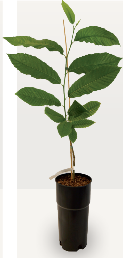
Injertos de 2 savias Envase de 5 L Grafted plants of 2 years 5 L container

Producción regular de híbridos de demanda habitual. Otros clones registrados o grandes cantidades por encargo. Regular production of hybrids of frequent use. Other registered clones or big quantities under request.